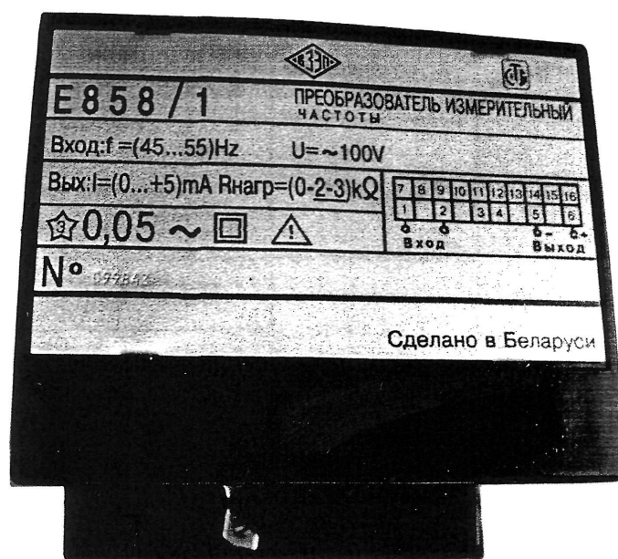
Рисунок 1 – Фотография общего вида преобразователей Е858

Конструктивное исполнение, диапазоны измерений преобразуемых входных сигналов, их номинальные значения, диапазоны изменения выходных сигналов преобразователей приведены в таблице 1.